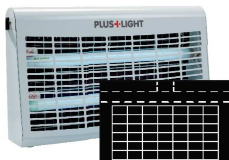
PLUS LIGHT™ 30W