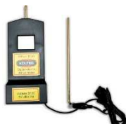
Tester di voltaggio digitale